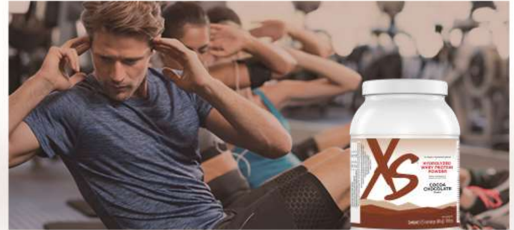
XS™ Hydrolysiertes Protein Pulver

Für eine schnelle Erholung nach dem Sport.