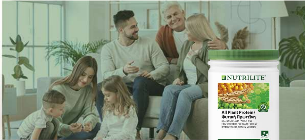
Nutrilite™ All Plant Protein